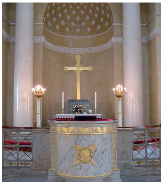
Alterpartiet i Christiansborg Slotskirke

Ved branden blev kirkens Marcussen-orgel reddet og taget ned i forbindelse med genopbygningen. Det venter dog stadig på at blive restaureret og genopsat i kirken. Indtil da benyttes et mindre, transportabelt orgel i kirken.