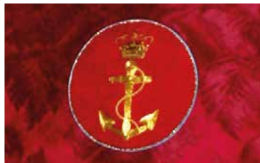
Forsidemotiv på den røde messehagel – Søværnets Ankertegn i guld.

Ved gudstjenstlige handlinger bar præsterne som oftest en hvid kjortel under messehagelen. Dette er baggrunden for, at messehagelerne i dag bæres over en såkaldt "alba" – en hvid underkappe.