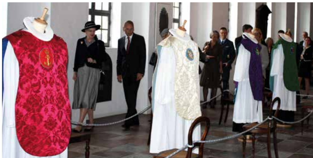
H. M Dronningen til stede ved udstillingen af de fire messehageler i Kapelsalen efter pinsehøjmessen

Pinsedag den 19. maj blev den sidste af de fire messehageler, som Hendes Majestæt Dronningen har designet til Holmens Kirke, taget i brug ved højmessen. Det drejer sig om den røde messehagel, der afslutter rækken, efter at den violette blev taget i brug 1. søndag i advent 2011, den grønne Trinitatissøndag 2012 og den hvide Palmesøndag 2013.