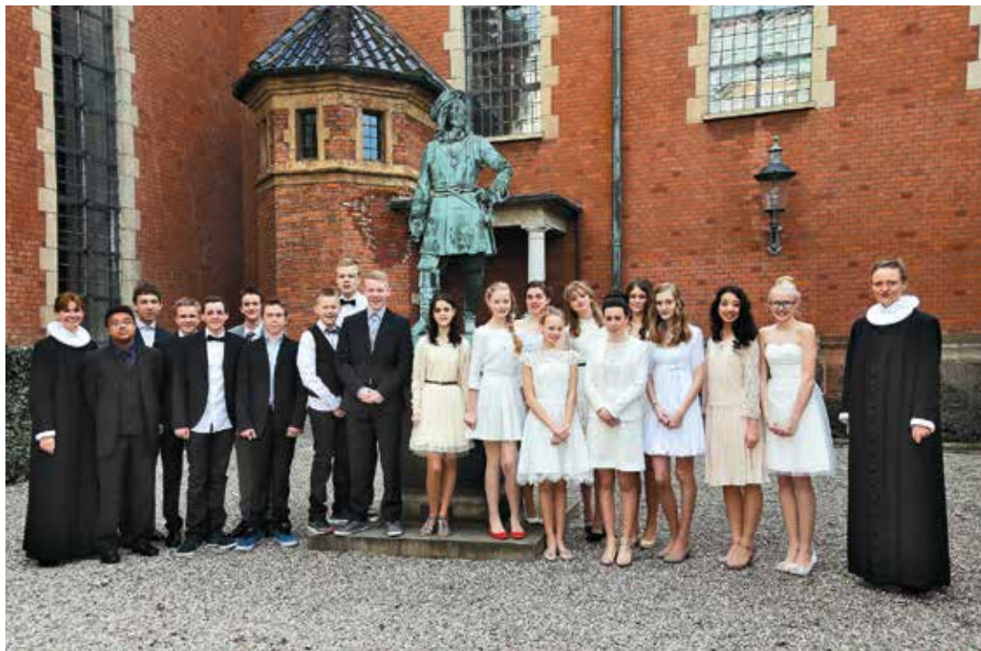
Konfirmation søndag den 7. april 2013