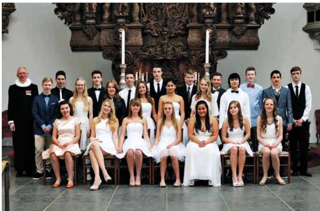
Konfirmation søndag den 14. april 2013