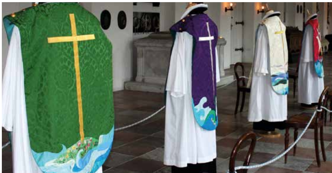
De fire messehageler

Reformationens gennemgribende opgør med den katolske kirkes gudstjenesteform satte også fokus på præsternes beklædning. Ved denne lejlighed indførtes som bekendt den nuværende sorte præstekjole, der var en overtagelse af den dragt, som universitetslærerne bar, når de underviste.