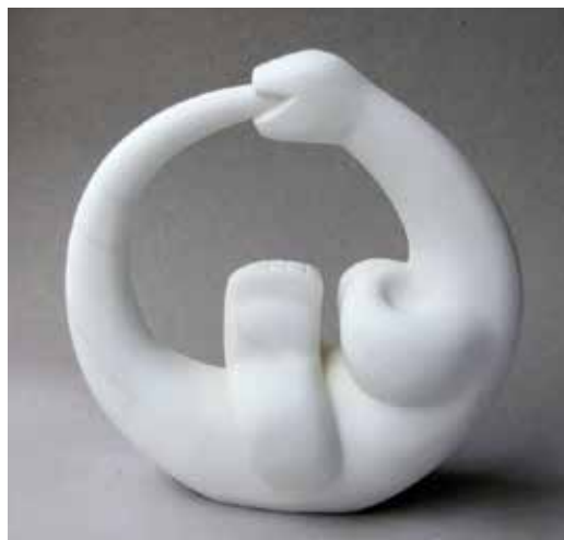
Ouroboros. Marmorskulptur af billedhugger Søren Koefoed